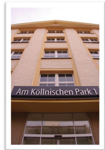
Eingang der Hochschule

Das Team der Akkon-Hochschule ist gern für Sie und Ihre Fragen da und freut sich auf Ihre Bewerbung für den Studiengang ›Pflegerwissenschaften‹.