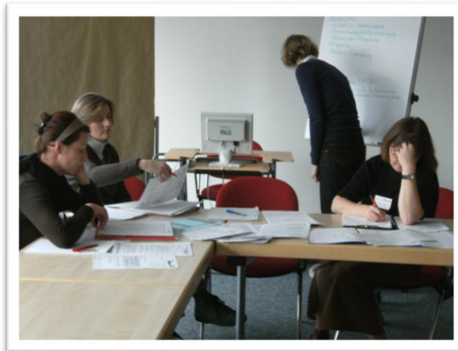
Gruppenarbeit in der Präsenzphase

Der Lehrplan gliedert sich in zwei Phasen. Jede dieser Phasen besteht aus verschiedenen Modulen, in denen einzelne Themen abgehandelt werden. Die Studierenden erhalten zu Beginn des Studiums das Modulhandbuch, das sie durch das Studium führt. Es enthält unter anderem Inhalte und Ziele der Module, die Dauer und auch die Form der Modulprüfungen.